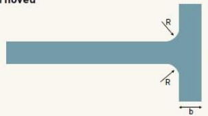
B. Principskitse Vendeplads udformet som symmetrisk hammerhoved

Cirkelformet vendeplads, bestemmende mål (m).